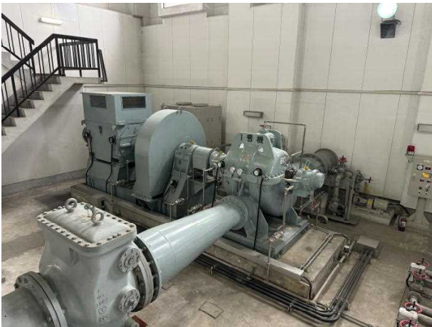
NO. 1 ポンプ全景